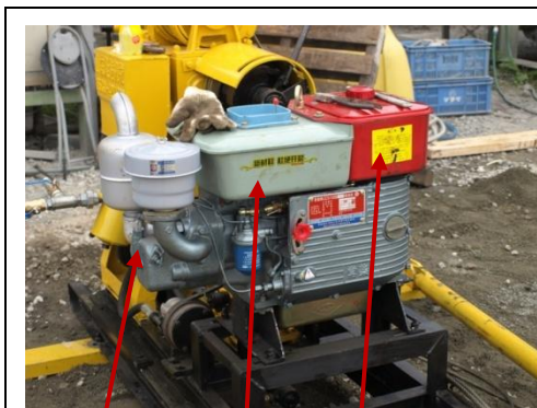
エンジンオイル 水 経由