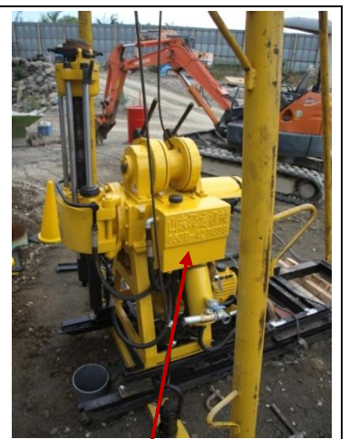
油圧オイルタンク